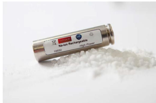
Batterie sodium-ion (Na-ion) au format industriel standard « 18650 », posée sur un tas de sel (NaCl).