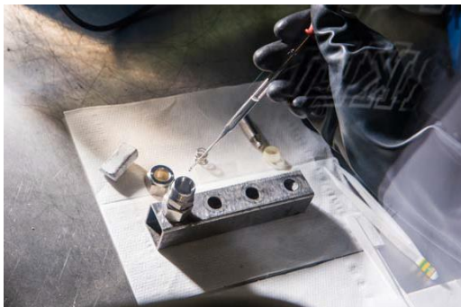
Assemblage de cellule pour le test de matériaux de batteries sodium-ion (Na-ion), dans une boîte à gants. Ces matériaux sont testés face à des électrodes de référence en sodium.