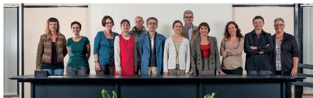
Les membres du Bureau d'HALMA et de la cellule Recherche.