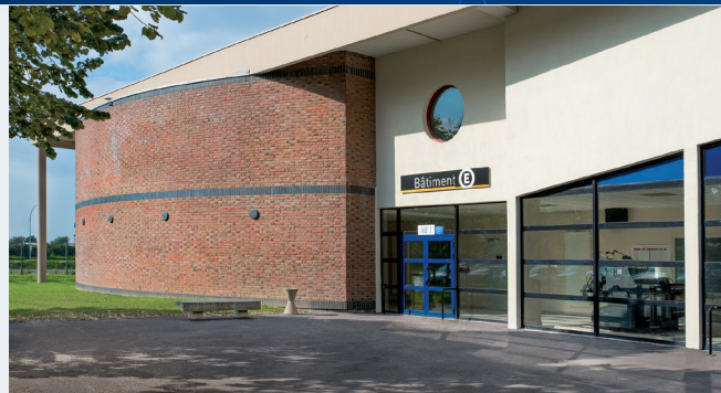
Bâtiment E, Quartier Ouest, Domaine Universitaire du Pont de Bois - Université Lille 3